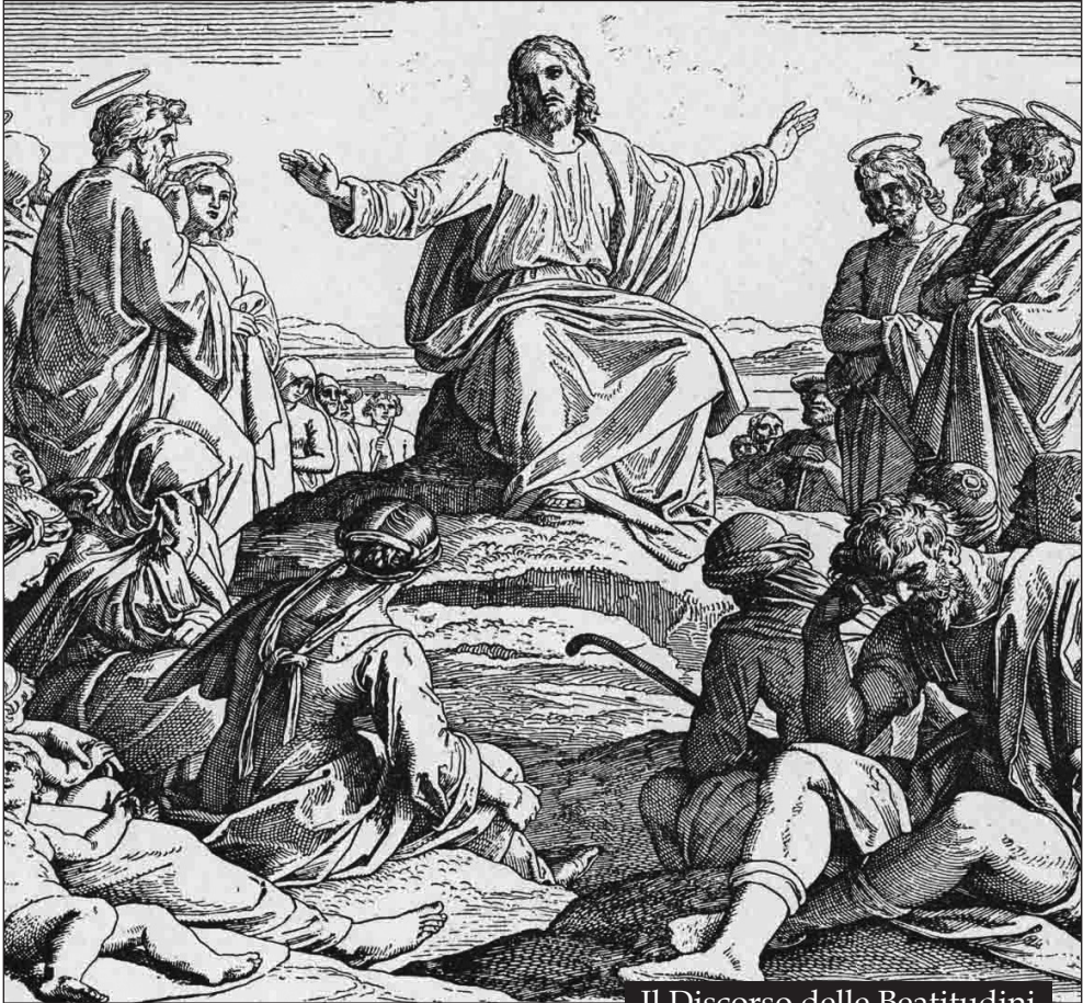
Il Discorso delle Beatitudini

perdere . Ecco, Dio non poteva vedere perso per sempre il suo capolavoro. Fu allora che con amore e per amore, pensò al meraviglioso progetto di salvezza che realizzò in Gesù. Il cuore del Vangelo è infatti la salvezza dell'uomo, la sua liberazione dal peccato e dalla tentazione, sostenendo la fragilità della sua condizione umana. Ecco allora che nei Vangeli, al verbo perdere , fa eco il verbo cercare .