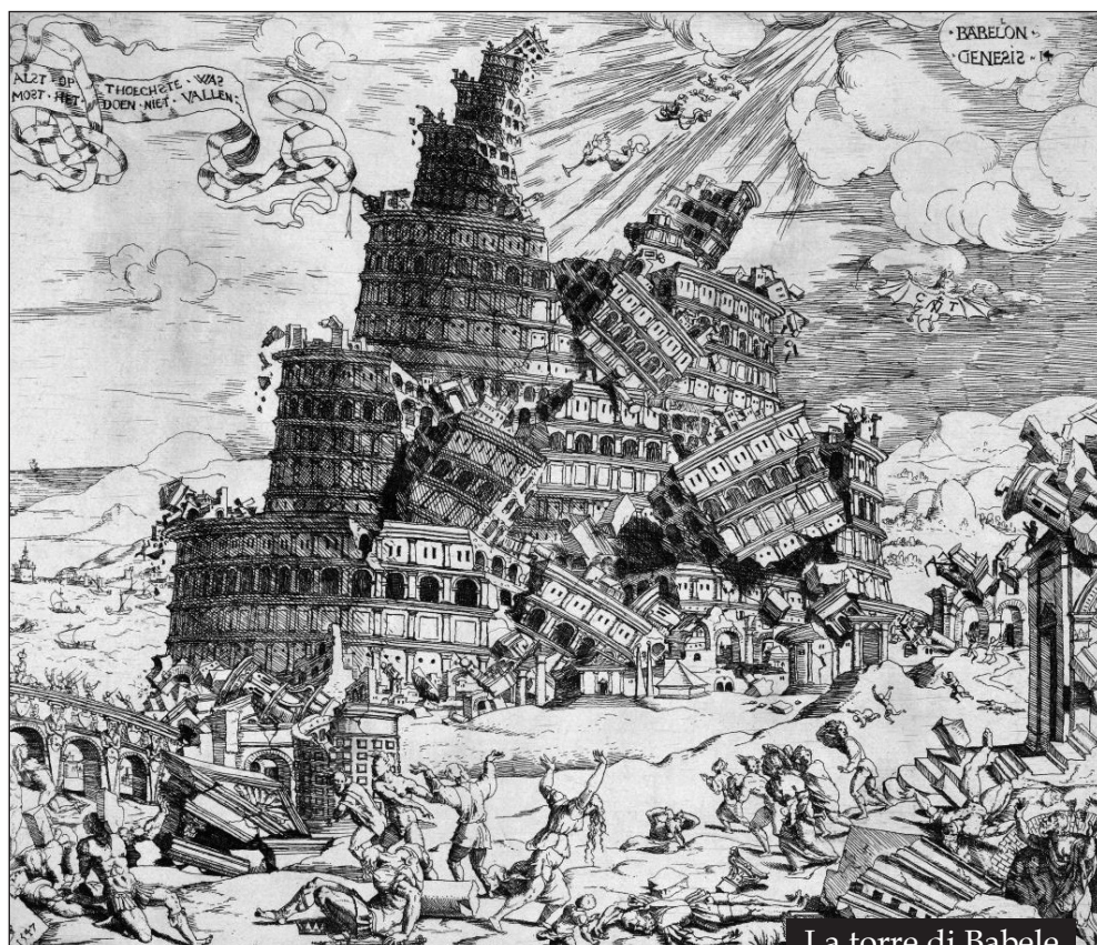
La torre di Babele

(Gen 11,5). Egli credette a Jahwèh che «glielo ascrisse come giustizia» (Gen 11,6). Anche qui è bene precisare che questo modo di esprimere la promessa di Dio ad Abramo riflette ancora una volta il linguaggio del genere letterario specifico, che rimanda ai modi di esprimere idee e concetti legati alla cultura del tempo.