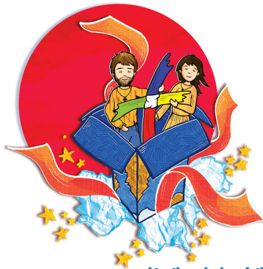
I testimoni e i profeti