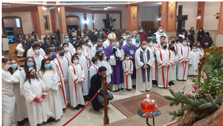
Incontro con i Ministranti