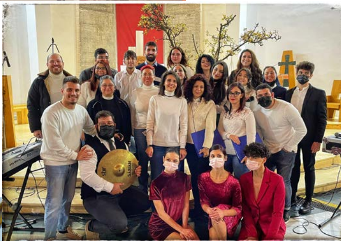
Coro Giovani Diocesano Carlo Acutis Scintille di Luce Concerto di Natale