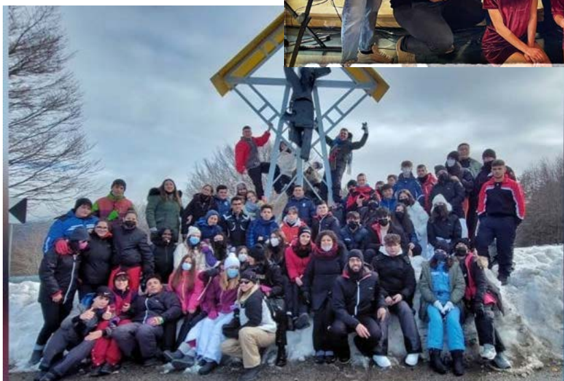
Campo Giovani Invernale